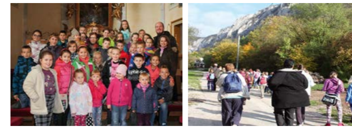
1. detská sv. omša