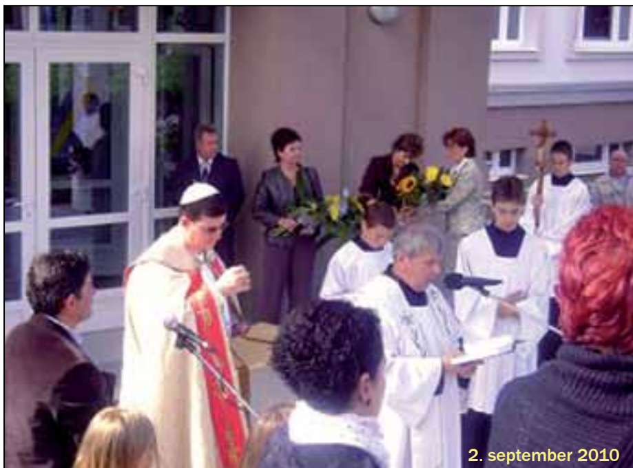
2. september 2010