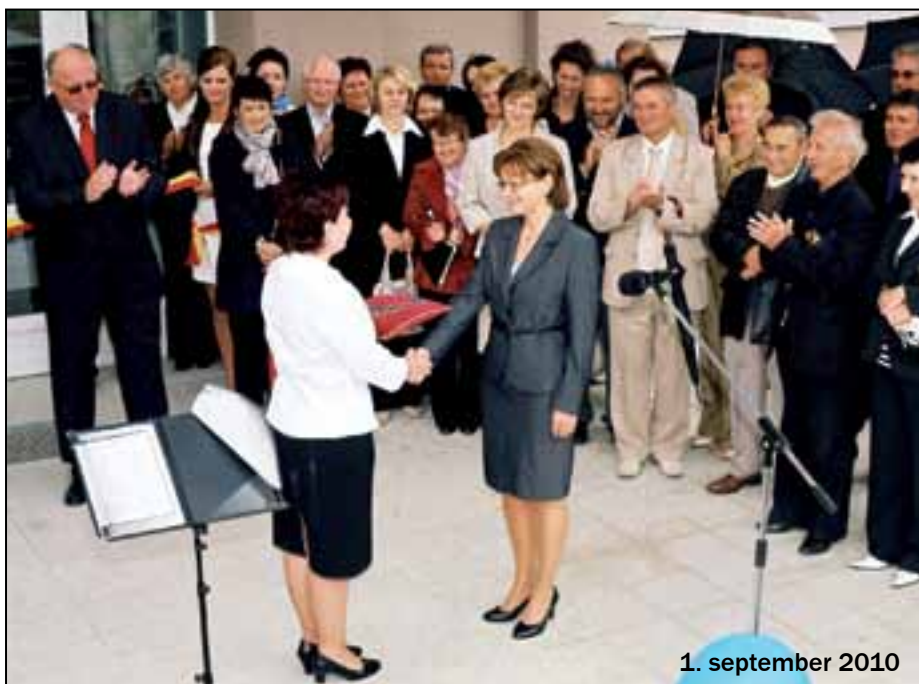
1. september 2010

Začiatok septembra sa už dlhoročne spája nielen so štátnym sviatkom, ale aj so začiatkom školského roka. V našej obci bolo otvorenie nového školského roka o to výnimočnejšie, že sa konalo na dvakrát. V magický deň 1. september 2010 bola slávnostne odovzdaná do užívania zmodernizovaná budova Základnej školy na Školskej ulici č.3 spolu s multifunkčným ihriskom na školskom dvore a následne 2. septembra otvorila svoje brány s požehnaním otcom opäť pre všetkých – malých aj veľkých. Svojím novým šatom sa tak stáva na nasledujúce obdobie druhou dominantou obce. (čítajte viac na st. 2)