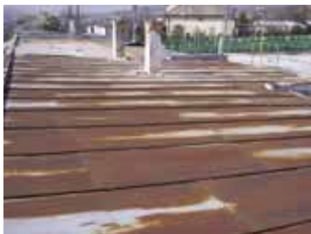
Rekonštrukcia komunitného centra – stará strecha