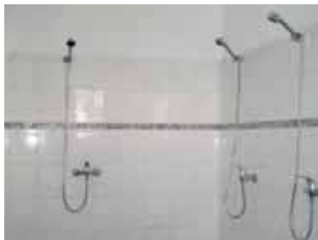
Rekonštrukcia komunitného centra – nové sprchárne