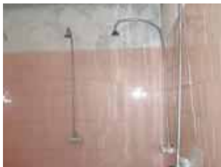
Rekonštrukcia komunitného centra – staré sprchárne