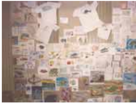
Z prác detí - ryby, rybky, rybičky a iný podmorský svet