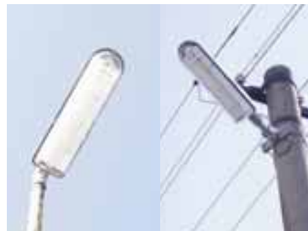
Nové verejné osvetlenie