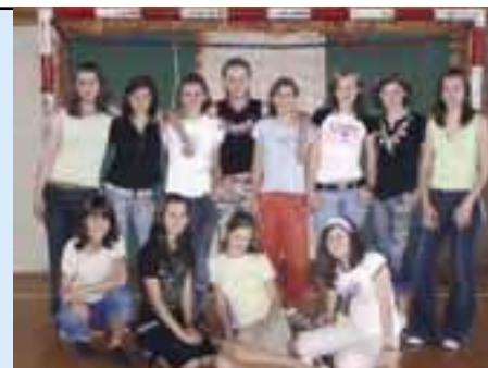
Nádejné hviezdy ženského futbalu