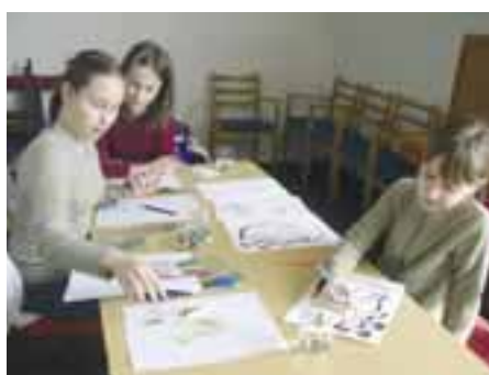
Tvorivá veľkonočná dielňa- vytváranie veľkonočných obrázkov a pohľadníc

Žiaden návštevník neodišiel naprázdno! Domov si odniesol maličkú spomienku na toto predveľkonočné stretnutie v podobe "veľkonočného kvetináčika"