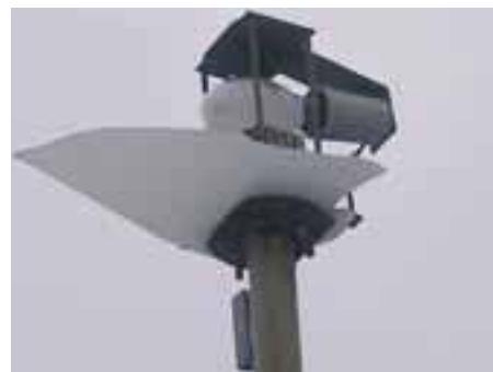
Staré verejné osvetlenie