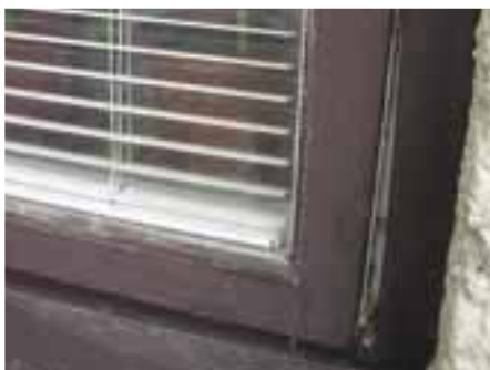
Jedno z mnohých - nedoliehajúce okno, cez ktoré je veľký únik tepla...

je nevyhovujúci, okná sú v dezolátnom stave a nedoliehajú. Strecha objektu nie je zaizolovaná vôbec.