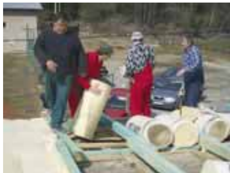
Pomocné práce pri rekonštrukcii komunitného centra