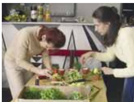
Všetci návštevníci si odniesli spomienku v podobe „veľkonočného kvetináčika“

s logom miestneho kultúrneho strediska. Niektorí prítomní len hlavou krútili, že si ľudia nechajú ujsť príležitosť zúčastniť sa na príjemnom a obohacujúcom tvorivom popoludní. "Ja tomu