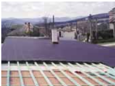
Rekonštrukcia komunitného centra – nová strecha