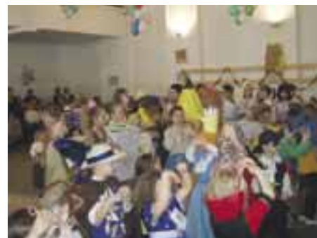
Tuto pirát, tam princezná, aj kuchár sa dnes zabáva...naokolo všade vládne najveselšia zábava!