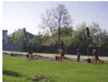
Vysádzanie okrasných čerešní pred KD

Nová sociálna politika je postavená na aktivite a iniciatíve jednotlivca, ktorý sa chce sám vyslobodiť zo sociálnej siete a určitým spôsobom priložiť ruku k dielu na zlepšenie svojej situácie. Jedným z prostriedkov, ktoré to nezamestnaným a najmä tým, ktorí sa nachádzajú v hmotnej núdzi, umožňujú, je aktivačná činnosť zabezpečovaná obcou. Aktivačná činnosť uchádzačov o zamestnanie sa realizuje v obci prostredníctvom Národného projektu č. V "Aktivácia nezamestnaných a nezamestnaných s nízkou motiváciou odkázaných na dávku v hmotnej núdzi",