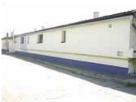
Exteriér komunitného centra

komunikácií sú totiž každoročne značnou položkou v rozpočte obce. Frézovanie výtlkov, penetrácia hrán výrezov a asphaltovanie horúcou zmesou sú cenovo náročné. Preto sa nedajú každý rok opraviť všetky úseky miestnych komunikácií. V tomto roku sme okrem opravy výtlkov dôslednejšie opravili povrchy ciest, a to na Krátkej ulici, ktorej povrch bol narušený pri stavbe obecnej kanalizácie a na časti Letnej ulice. Výtlky, ktoré nám aj napriek vykonaným opravám v obci zostali, hlavne v strede vozoviek, budeme riešiť vo vlastnej rézii náhradným riešením (betónovaním).