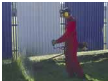
Kosenie verejných priestranstiev

S pomocou občanov obce zaradených do aktivačnej činnosti