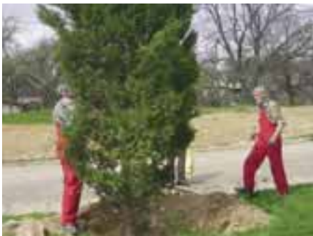
Vysádzanie novej zelene pri KD