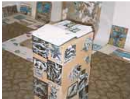
Putovná kronika obohatená možno aj o váš podpis

V čase od 13. marca 2006 do 20. marca 2006 sa v priestoroch malej sály MKS Poproč uskutočnila výstava prác detí, ktoré sa zúčastnili v máji minulého roku na týždennom krajinárskom kurze organizovanom v škole v prírode vo Vyšnom Medzeve. Putovanie ako aj všetky výstavné kresby, maľby, koláže a ostatné výtvary