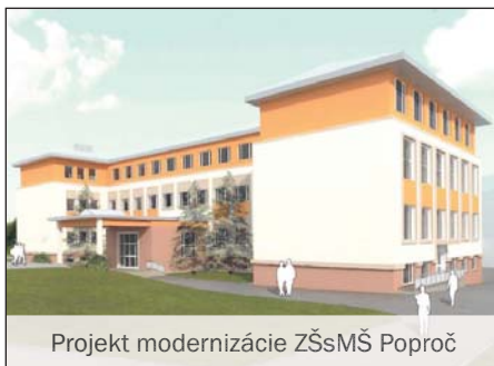
Projekt modernizácie ZŠsMŠ Poproč

Najviac času a hodín prípravy sme doteraz venovali hlavne vypracovaniu realizačného projektu „Modernizácia