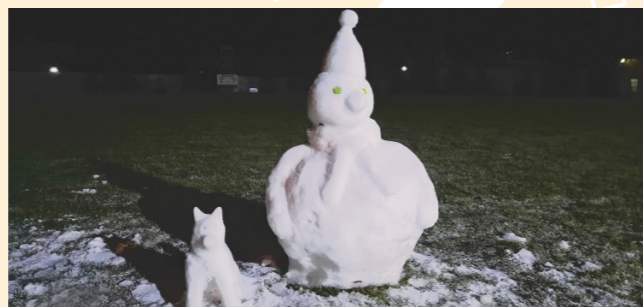
(Na foto respondent s vojacom a „umeleckí“ snehuliaci, ktorých postavili členovia tímu ako odraovanie sa cez prestávky.)